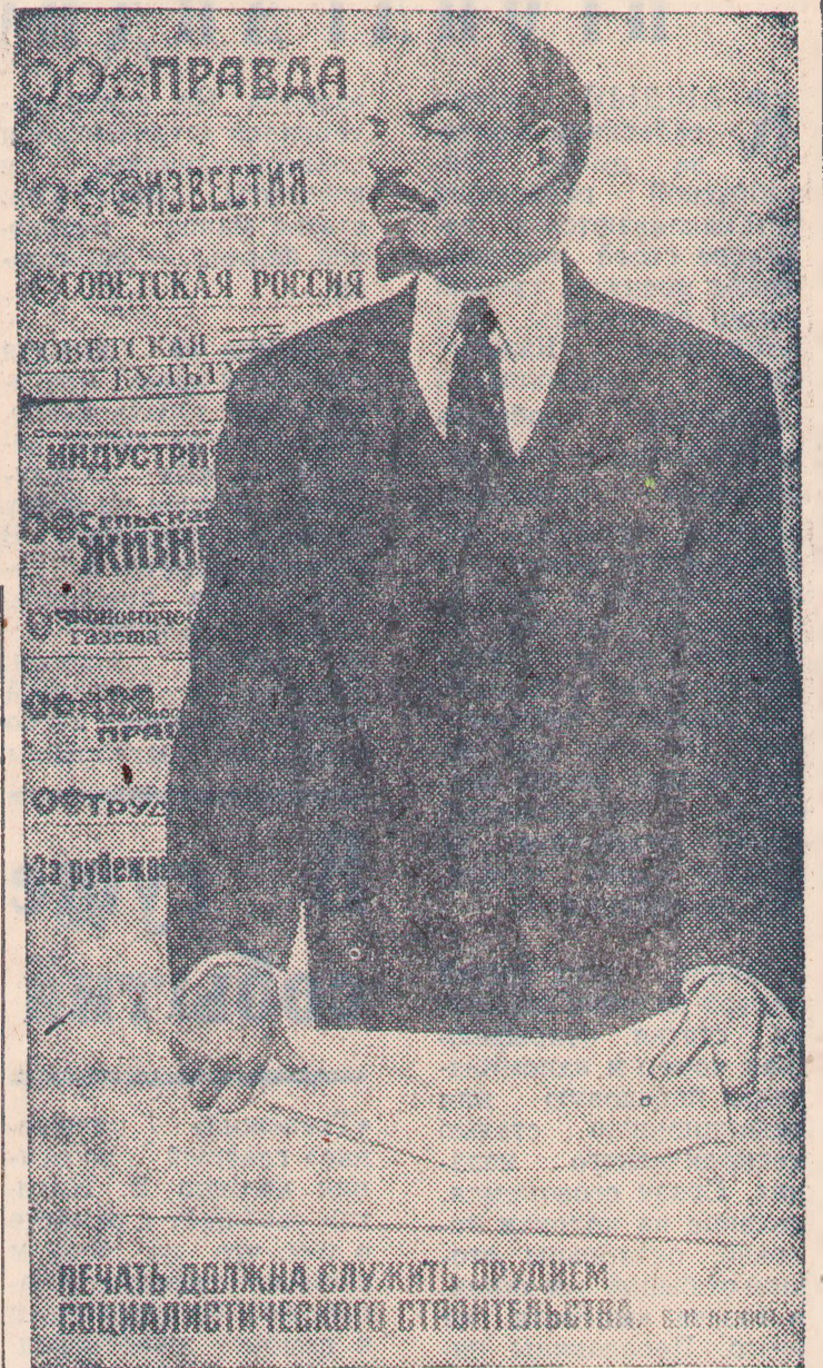
Плакат художника Э. Арцруняна. Издательство «Плакат».