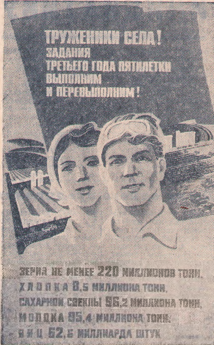
Плакат художника Г. Гаусмана. Издательство «Плакат».