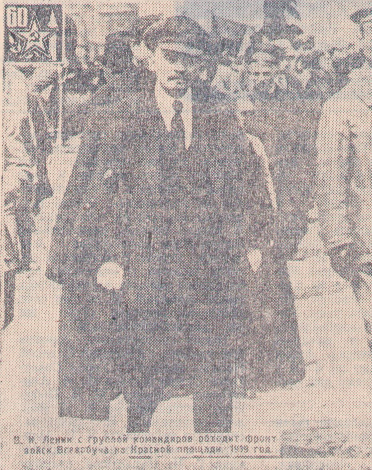
В. И. Ленин с группой командиров обходит фронт войск Всевожуча на Красной площади. 1919 год.

В. И. Ленин и Коммунистическая партия — создатели первой в мире Рабоче-Крестьянской Красной Армии, которая, разгромив белогвардейцев и интервентов, показала себя верным защитником молодой Республики Советов.