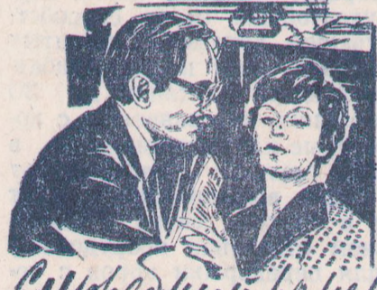
Производство «Мосфильм». В главных ролях: Алиса Фрейндлих, Андрей Мягков. Начало в 17, 20 часов.

Армавирской дистанции пути Северо-Кавказской железной дороги для содержания и ремонта пути ТРЕБУЮТСЯ