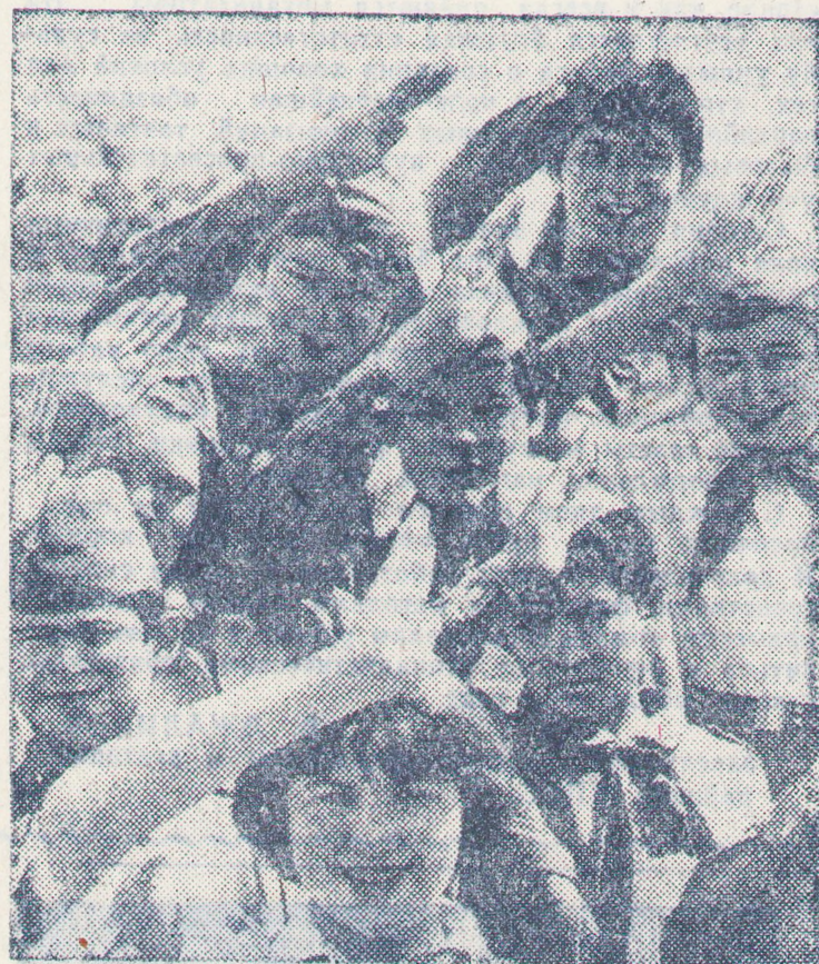
УКРАИНСКАЯ ССР. КРЫМСКАЯ ОБЛАСТЬ. 4,5 тысячи школьников из всех уголков нашей страны ежегодно отдыхают во всесоюзном пионерском лагере «Артек» (на снимке).