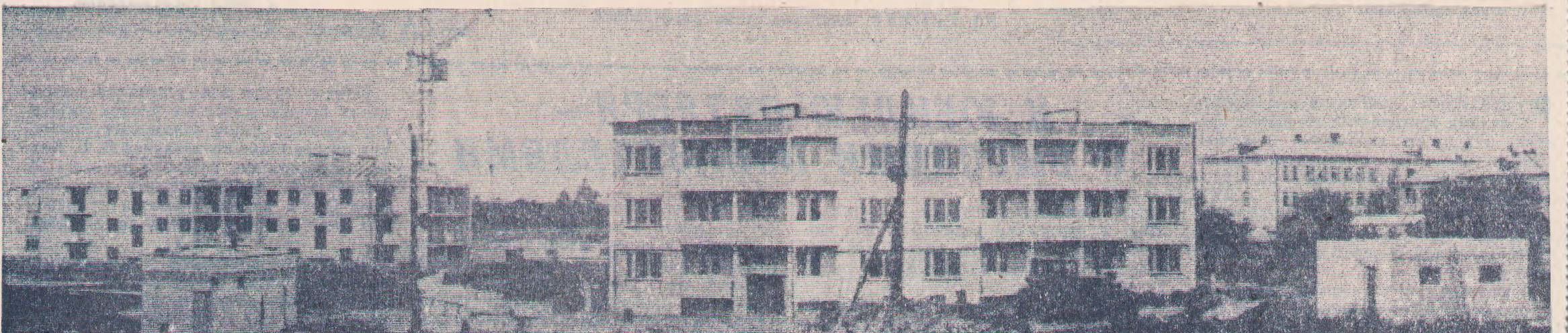
НА СНИМКЕ: идет строительство новых жилых домов в селе Кочубеевском в районе школы № 3.