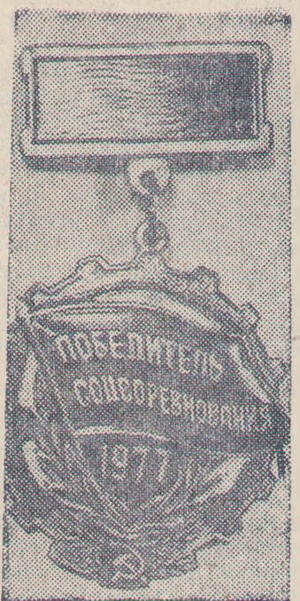
Знак «Победитель социалистического соревнования 1977 года».