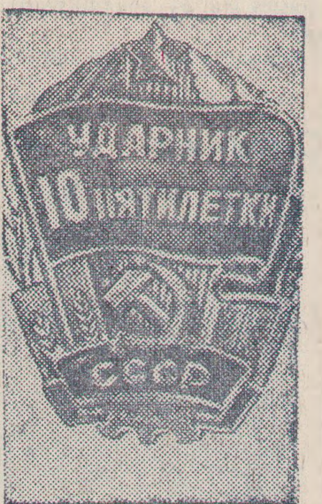
Знак «Ударник десятой пятилетки».