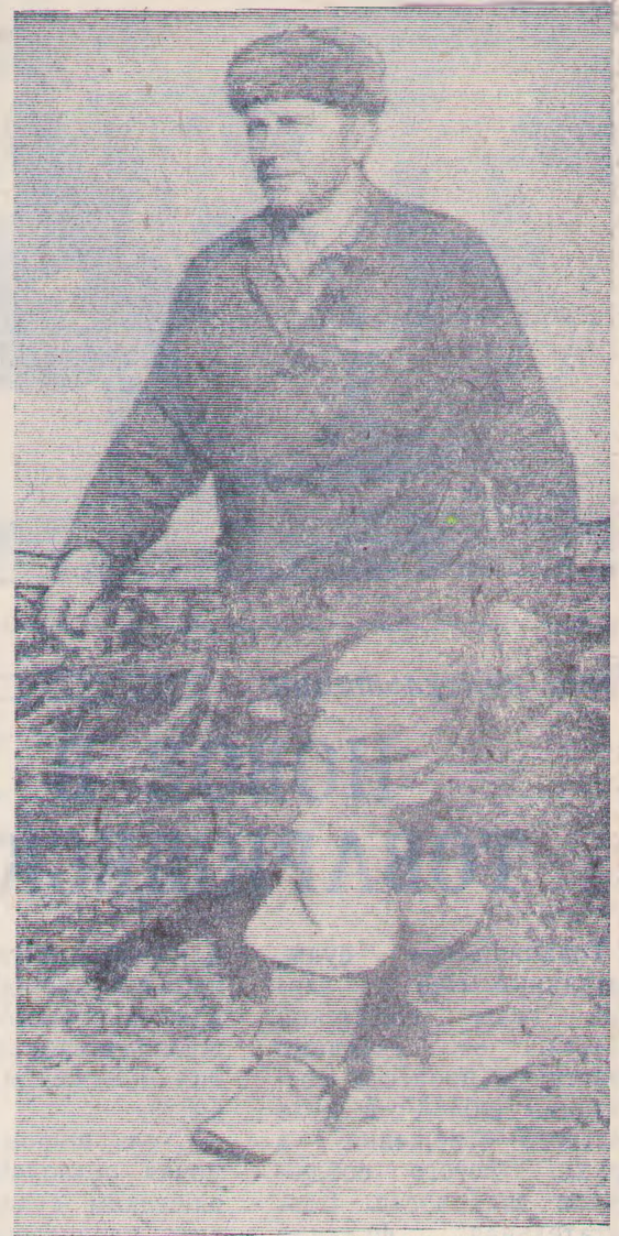
трудолюбивыми и любящими свою землю. Родители понимали, что иначе в их семье — семье механизатора и доярки — и быть не может.