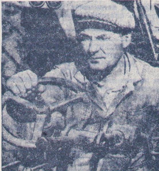
прилегающих дорог и лесополосы обрабатываем ядохимикатами против свекловичной блошки.

Весной, если она ранняя и есть в этом необходимость, закрываем влагу. При поздней весне производим предпосевную обработку культиваторами УСМК-5.4 с одновременным внесением гербицидов. И только после этого приступаем к севообороту. Для этого при этом предпочтительнее жидкими семенами ялтычковского гибрида и вносим их по 10—12 штук на каждый погонный метр. После посева обочины