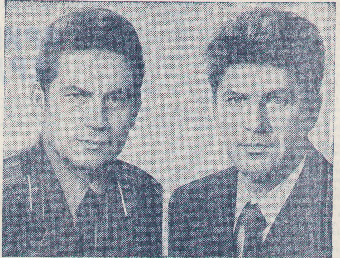
Коваленок Владимир Васильевич — командир космического корабля «Союз-25». Рюмин Валерий Викторович — бортинженер космического корабля «Союз-25».

Состояние здоровья космонавтов Коваленка В. В. и Рюмина В. В. после приземления хорошее.